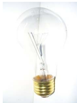
# 550017 LUMIERE 50W R.S (50A19-10) 101 en inventaire