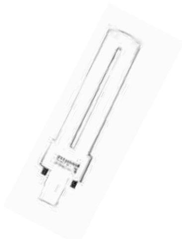
# 550911 FLUORESCENT COMPACT 7W SYLVANIA 30 en inventaire