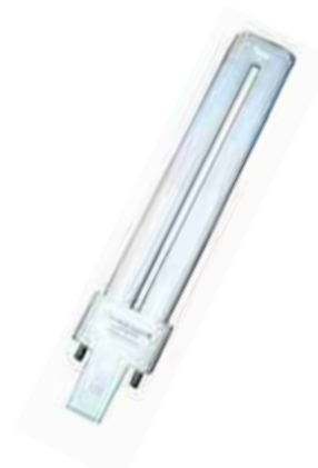
# 550912 FLUORESCENT COMPACT 9W ENERTRON 126 en inventaire